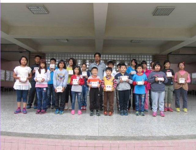
母親節快樂要知恩、感恩、報恩