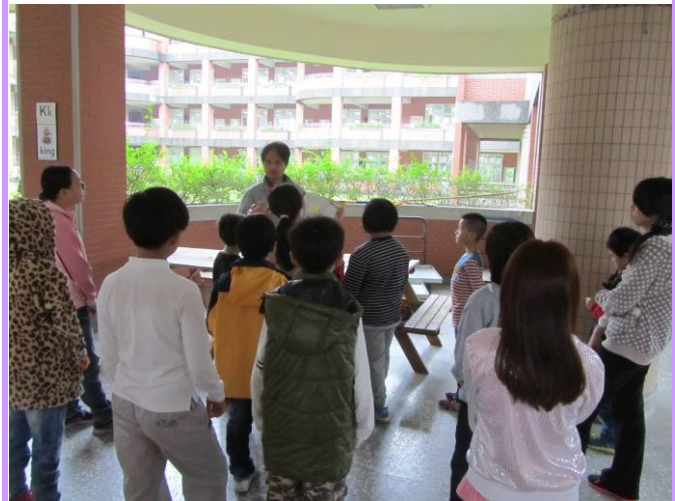
總務主任殷殷叮嚀要惜福常懷感謝心