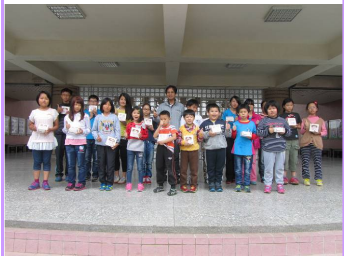
謝謝社會上關照弱勢家庭的善心人士