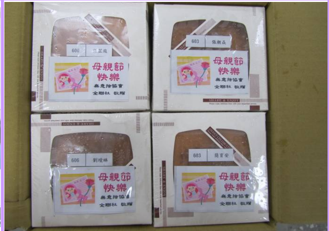
慶祝母親節感恩全聯社提供小蛋糕