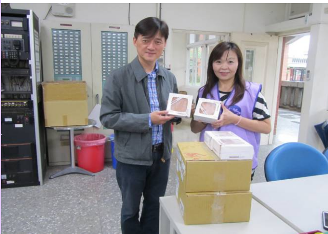
校長代表接受無意捨協會 20 份小蛋糕